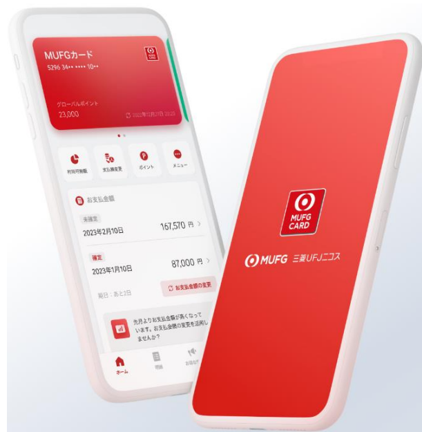
「MUFGカードアプリ」の画面イメージ

当社では今後も、お客さまニーズを的確に捉え、安全・安心、快適な会員サービスを拡充させていきます。