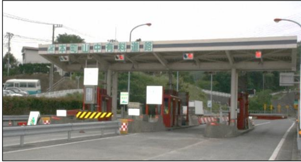
本町山中有料道路