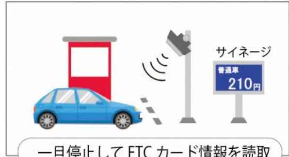
E T C 読取イメージ