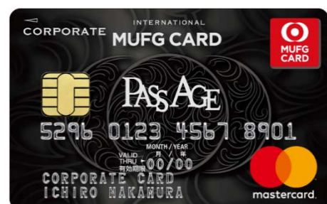
PassAge 導入企業専用コーポレートカード